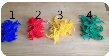
4명이 할 경우 파랑, 빨강, 노랑, 초록 한가지씩