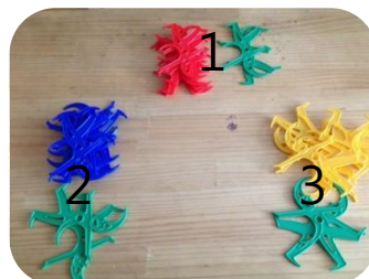
3명이 할 경우 각자의 색에 초록색 2개씩