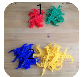
2명이 할 경우 2가지 색 사용!